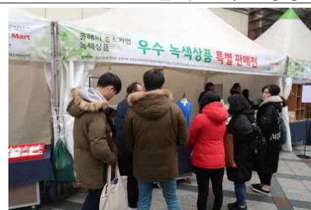
<올해의 녹색상품 중소기업제품 특별판매전 / 17.11.23~11.25 롯데마트 잠실점>