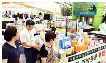
<올해의 녹색상품 중소기업제품 특별판매전 / 17.8.10~8.12 홈플러스 부천상동점>