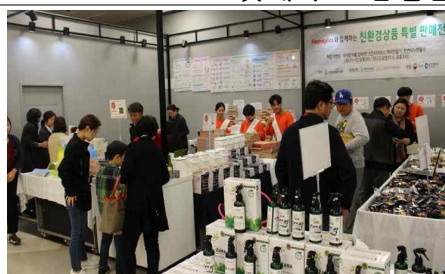
<올해의 녹색상품 중소기업제품 특별판매전 / 18.10.11~10.13 홈플러스 간석점>