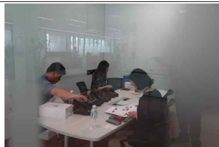
<올해의 녹색상품 중소기업제품 입점상담회/17.7.20.홈플러스 본사>