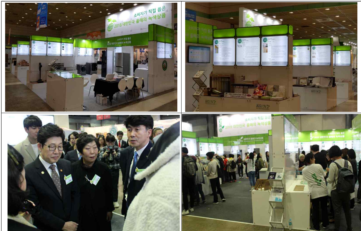
조명래 환경부 장관 및 국회의원 등 친환경대전 참여내빈의 올녹상 부스 방문